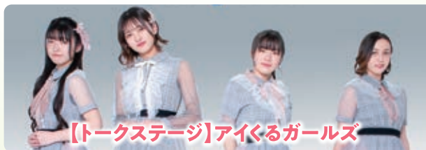
【トークステージ】アイくるガールズ